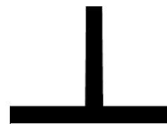
BASTON TIPO T